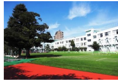
大井第一小学校 学区 徒歩7分