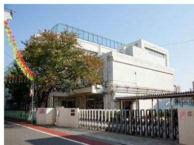
浜川小学校 学区域 徒歩4分